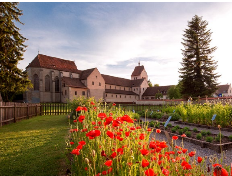
Kräutergarten auf der Insel Reichenau

Ausgehend vom Klosterplan in St.Gallen führt die Klostergartentour über die Kartause Ittingen und die Klosterinsel Reichenau bis zu den barocken Klöstern mit ihren Gärten in Oberschwaben. Der Besuch der Klostergärten wird zu einer abwechslungsreichen Zeitreise durch die Geschichte der Gartenbaukultur in der Bodenseeregion.